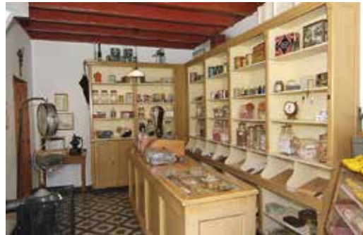
Het interieur van een winkeltje in het Boerenbondsmuseum in Gemert

Om kwart over vier is iedereen weer terug, waarna Arnoud-Jan Bijsterveld de dagafsluiting verzorgt en er een drankje genuttigd kan worden.