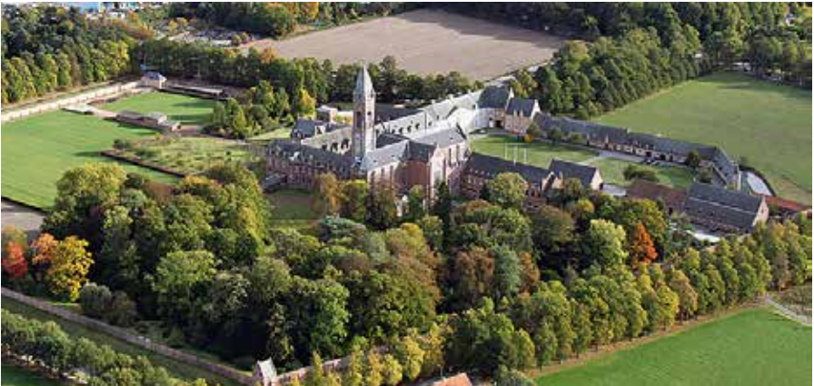
De abdij van Tongerlo waar de studiedag dit jaar plaatsvindt