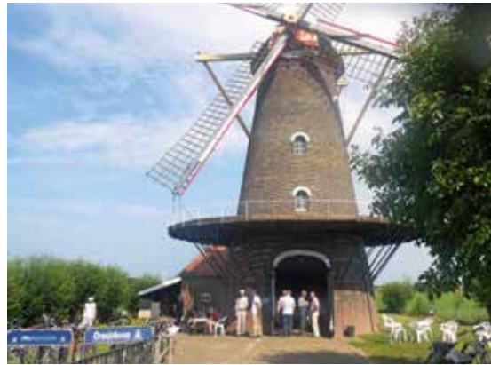
De molen 'Zeldenrust' in Hooge Zwaluwe

naar Drimmelen waar in 'Ons Dorpshuys' ook voor deze groep de lunch gereed stond. In de middaguren werd het programma omgedraaid. De groep die naar Geertruidenberg was gefietst, reed nu naar Hooge Zwaluwe en de groep die in Hooge Zwaluwe had rondgereden bezocht nu Geertruidenberg.