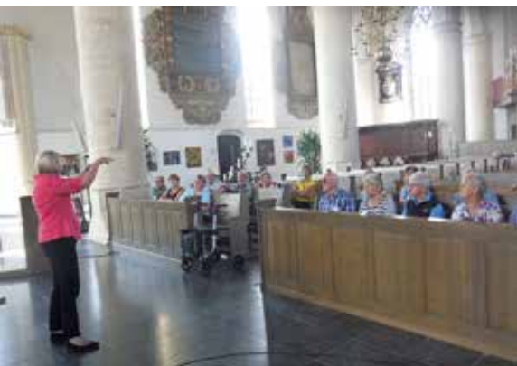
In de Geertuidskerk wordt uitleg gegeven en een bezoek gebracht aan de tentoonstelling over het Halve Zoollijntje

van deze streek. Er was tijdens de aanleg wel rekening gehouden om eventueel in een later stadium de lijn dubbelspoors te maken. Daar is het nooit van gekomen, vandaar dat mensen vonden dat het om een 'halve zool' ging, omdat de helft maar gereed kwam.