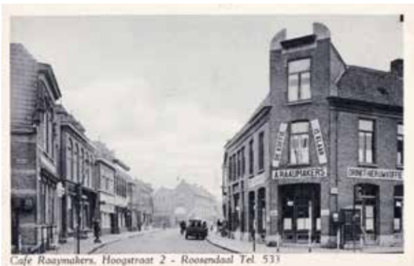
Het inmiddels verdwenen café Raaijmakers aan de Hoogstraat in Roosendaal

Die historie en die sfeer had ook zijn mooie kanten. Denk maar eens aan de tijd dat Roosendaal een aantal cafés had dat er niet om loog. En die cafés moesten ergens hun bier vandaan halen. Daar waren brouwerijen voor, ook in Roosendaal!