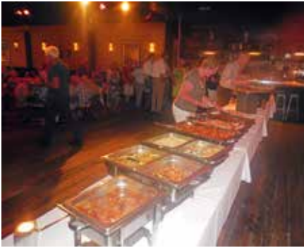
Een buffet om van te smullen

Daarna was het nog niet gedaan voor deze avond, want de Veto Sisters uit Dongen zorgden voor een mooi stuk