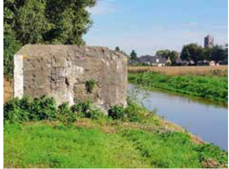
Het defensiekanaal met kazemat in de buurt van Mill