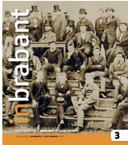
De cover van de nieuwe 'In Brabant' met een klassenfoto van Vincent van Gogh. Hij zit vooraan in het midden

Het Van Gogh Jaar 2015 – ter ere van de 125ste sterfdag van de bekende schilder – bevindt zich inmiddels in zijn negende maand. De datum waarop Vincent in 1890 overleed, 29 juli, ligt al een tijdje achter ons. Al is Van Goghs' dood de aanleiding voor dit herdenkingsjaar, in de nieuwe 'In Brabant' kijken we vooral naar zijn leven. We nemen u graag mee langs de plekken van Vincents bestaan in Noord-Brabant. In een uitgebreid beeldverhaal, opgebouwd uit foto's en ansichtkaarten uit de late negentiende en vroege twintigste eeuw, volgen we hem van zijn geboortedorp Zundert tot aan Nuenen, de laatste plek van Vincents Brabantse tijd. Tussendoor stoppen we ook op de andere Brabantse plaatsen die met het leven van de kunstenaar verbonden zijn, zoals Tilburg, waar Vincent de HBS bezocht. Op de cover van deze In Brabant ziet u zijn 'klassenfoto' uit