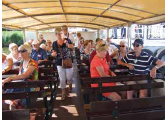
De deelnemers gaan aan boord voor een tocht door de Biesbosch

zich bijna niet in het onherbergzame gebied en via de Biesbosch konden medicijnen en voedsel naar het noorden worden gesmokkeld en onderduikers en piloten naar het zuiden. Vooral de verhalen van de mensen die dit gevaarlijke werk verrichten waren interessant, maar daar zou in de loop van de dag nog veel meer over verteld worden. Deze groep kreeg onderweg een lunchpakket op de terugweg naar het Biesboschcentrum