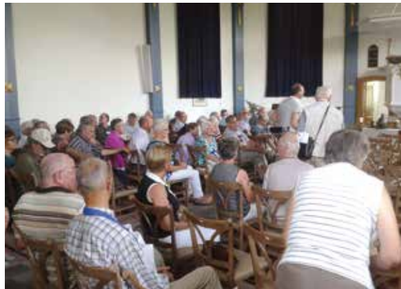
De lezing in de kerk van Drimmelen

Tegen vijf uur was het hele gezelschap weer bij elkaar in 'Ons Thuis' in Terheijden. Daar ging het programma verder met een lezing over de Liniecrossers en hun niet van gevaar ontblote werk in