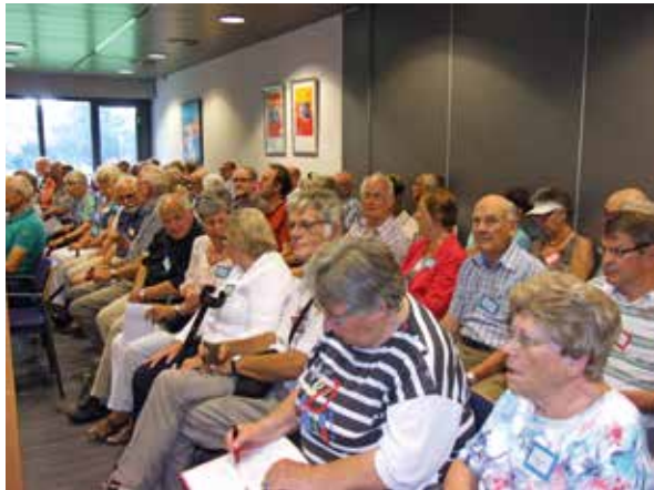
Een aantal deelnemers in de raadszaal van het gemeentehuis van Drimmelen

In één adem somde hij een reeks van bijzondere zaken op. De eendenkooi, de verdedigingswerken, klei- en zandculturen, de watersportactiviteiten, de oude Napoleonsweg, het bezoekerscentrum de Biesbosch en de expositie van de Langstraatspoorlijn in de kerk van Geertruidenberg. Ook kersen, aardbeien, asperges en 'Het beste worstenbrood van Brabant' kwamen langs en activiteiten als het verbouwen van 'spelt', dauwtrappen en koningsschieten. „Bedenk dat Drimmelen de voortuin van de Biesbosch is, maar meteen ook de achtertuin van Breda”, besloot de Drimmelse wet-