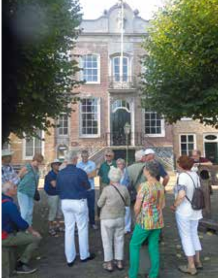
In Geertruidenberg voor het raadhuis

In de Geertruidskerk konden de deelnemers aan de Heemdagen de expositie van de Langstraatspoorlijn bekijken. In de volksmond ook wel 'Halve Zolenlijn' genoemd, het was een enkelbaans spoorlijn die van Lage Zwaluwe via Waalwijk naar 's-Hertogenbosch liep. De bijnaam Halve Zolenlijn refereerde aan de schoenenindustrie en was ironisch bedoeld voor de inwoners