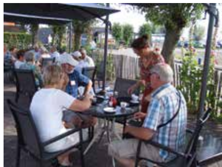
Koffie met een appelpunt en flink wat slagroom om de inwendige mens te versterken

De eerste groep ging met de boot de Biesbosch in om er de natuur te bekijken en een wandeling te maken