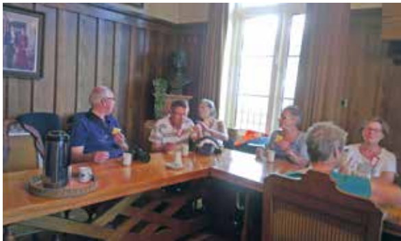
In het museum van Willem Snickerieme

Na al die bijzondere dingen en het moois ging het door de polder terug