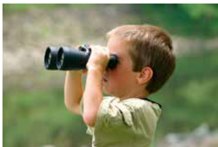
De foto die de voorzijde van het rapport siert

Voor het project werden steeds een man en vrouw per leeftijdsgroep geïnterviewd. De geïnterviewden behoren tot de tachtig-, eind vijftig-, veertig- en twintigjarigen. Heel opmerkelijk bij elke leeftijdsgroep was het antwoord op de vraag waar de klasgenoten van de basisschool woonden. In iedere leeftijdsgroep