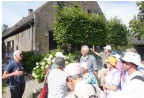
De gids geeft informatie bij een monumentale boerderij in Drimmelen

De tweede groep ging op stap met gidsen om een dorpswandeling te maken door Drimmelen. Die gidsen wisten de mooiste en interessantste plekje er uit te pikken. In de Hervormde kerk werd een PowerPointpresentatie verzorgd waarbij ook een stuk historie van het gebied aan bod kwam. Dankzij het uitermate fraaie weer, was het een genot om door de groene omgeving en de waterkanten te lopen. De groep wandelaars keer-