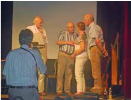
Enkele jubilarissen worden gehuldigd

Onderdeel van de avond was ook het uitreiken van de eremedailles aan mensen die een jubileum vierden. En natuurlijk werd er nog een tijdlang nagekaart over het programma van de voorbije dag onder het genot van een al dan niet alcoholische versnapering.